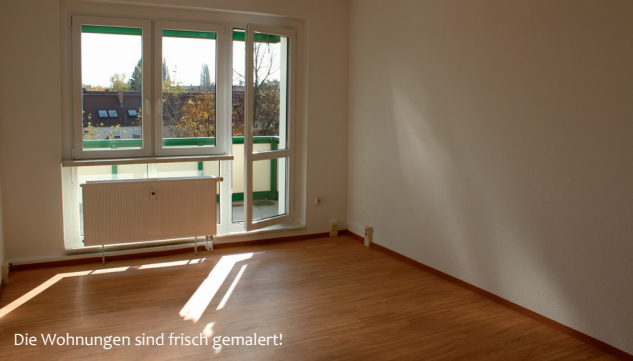
Die Wohnungen sind frisch gemalt!