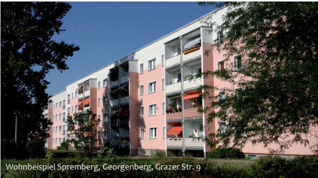
Wohnbeispiel Spremberg, Georgenberg, Grazer Str. 9

Als Einstieg in die eigenen vier Wände erhalten junge Einwohner oder junge Familien folgendes Angebot* für ein neues Zuhause.